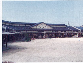
町立相可保育園 約2,000m(車で約3分)