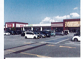
多気クリスタルタウン 約1,300m(車で約2分)