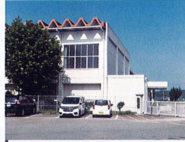
町立相可小学校 約1,650m(徒歩約21分)