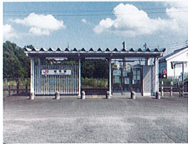
JR紀勢本線「相可」駅 約450m(徒歩約6分)