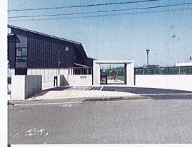
多気町松阪市学校組合立多気中学校 約500m(自転車車で約3分)